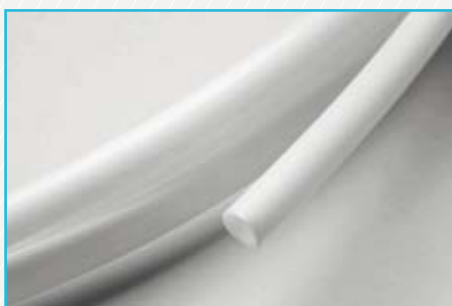
Fuel Line Radilon® D ultraflexible (PA610, extrusion grade)