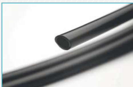
Brake Decompression Pipe Radilon® D flexible (PA610, extrusion grade)

Main applications: Fuel line connectors - Pneumatic conduits - Brake lines - Fuel lines - Under-the-bonnet components.