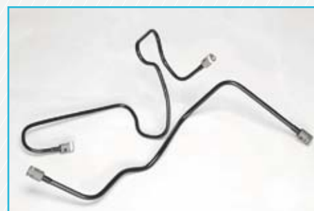
Fuel Line Radilon® D semiflexible (PA610, extrusion grade)

La gamma RADILON® D nasce nell'ambito di un progetto da tempo in atto all'interno dell'area materie plastiche di RadiciGroup: realizzare materiali plastici all'insegna di un'innovazione sostenibile. Le PA610 sono caratterizzate da un ridotto impatto ambientale e, al tempo stesso, da proprietà equivalenti se non superiori a quelle delle poliammidi tradizionali.